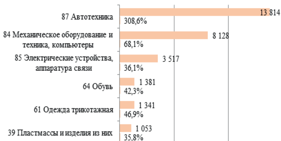
Рис. 2 – Товарные группы с наибольшим приростом в экспорте Китая в ЕАЭС в январе–августе 2023 г. по сравнению с январем–августом 2022 г. (в млн долл. США и в % к АППГ)