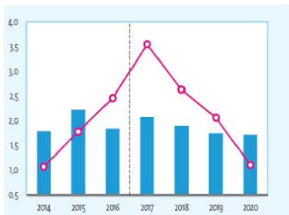
Прогноз развития строительства в странах ЕС, в % по сравнению с предыдущим годом

■ Динамика ВВП —○— Динамика объемов строительства