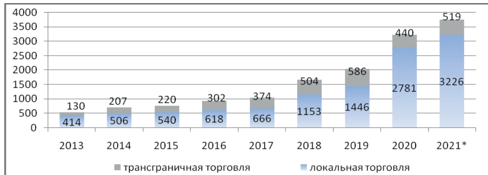
Рис. 1. Развитие российского рынка интернет-торговли (локального и трансграничного) в 2010-2020 гг., млрд руб. [15]

Россия входит в десятку стран мира с наиболее развитой системой электронной торговли. На динамичном развитии электронной торговли в России не сказался даже мировой кризис, вызванный пандемией COVID-19 (см. рисунок 1).