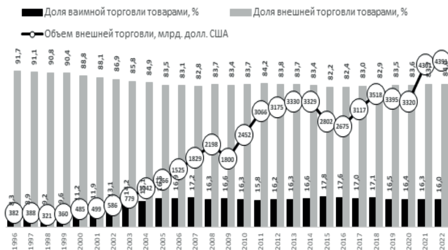
Рис. 1. Динамика торговли товарами РТИ по импорту в 1996-2022 гг.