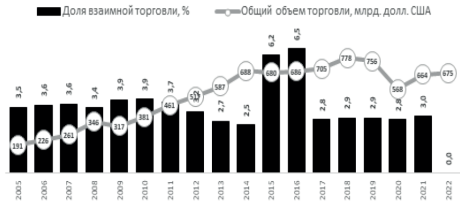
Рис. 2. Динамика торговли услугами РТИ по импорту в 2005-2022 гг. Fig. 2. Dynamics of trade in RTI services by import in 2005-2022.

Источник: составлено по: UNCTAD Stat. URL: https://unctadstat.unctad.org/datacentre/ (дата обращения: 05.09.2023).