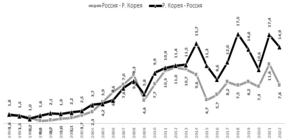
Рис. 4. Динамика импорта товаров между странами, млрд долл. США Fig. 4. Dynamics of imports of goods between countries, billion US dollars

Необходимо понимать, что в противоположность партнерству России с Республикой Кореей, стабильный рост взаимной торговли с Китаем – процесс закономерный . Первый стал одним из субъектов антироссийских санкций, а второй – сохраняет относительный нейтралитет (см. рисунок 4).