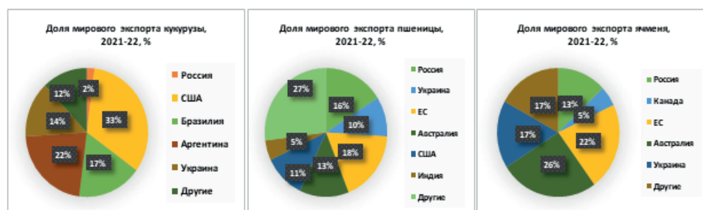
Рис. 1 – Доля экспорта зерновых РФ, 2021-22 гг., %

ячменя, 2% – кукурузы (см. рисунок 1). В физическом эквиваленте эти показатели составили 32 млн т., 5 млн т и 4 млн т соответственно. Среди производителей пшеницы Россия уверенно занимает 3-е место (1,2 млрд тонн), уступая лишь странам с самым большим населением в мире Индии (1,8 млрд тонн) и Китаю (2,4 млрд тонн).