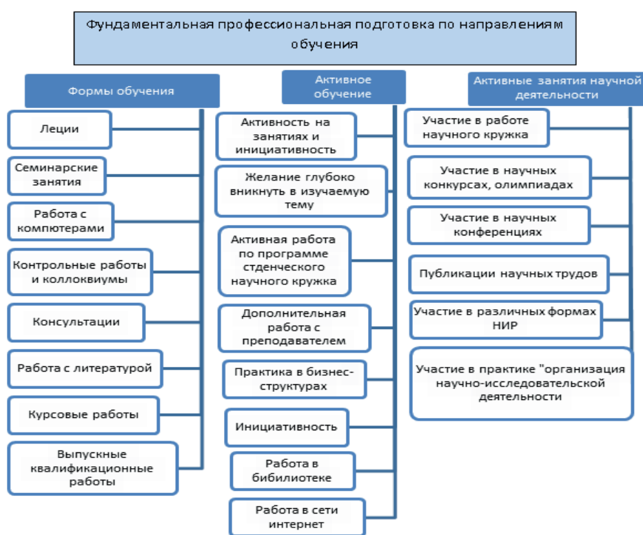
Рис. 3. Модель фундаментальной и профессиональной подготовки в ВАВТ Fig. 3. Basic and vocational training model at RFTA

Общая модель фундаментальной и профессиональной подготовки в Академии полностью соответствует системам подготовки в других ВУЗах (см. рисунок 3) [2].