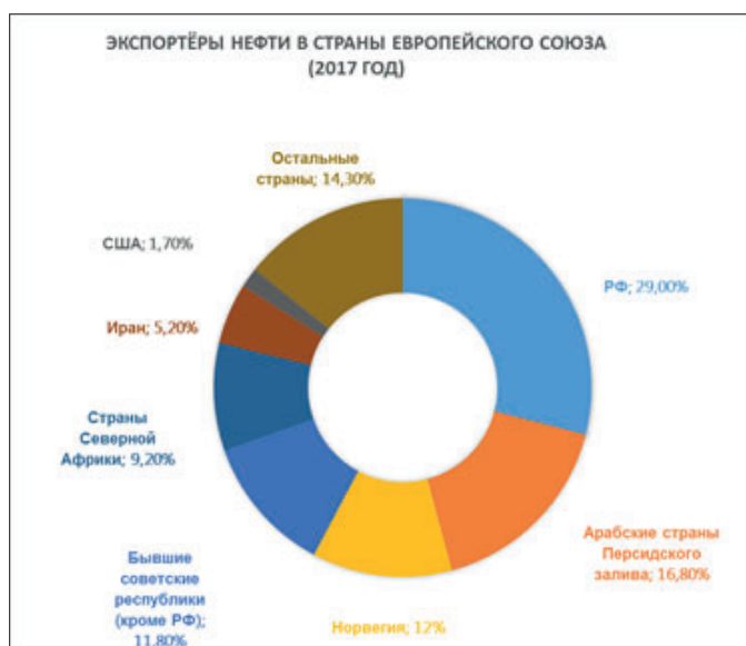
Экспортёры нефти в страны Европейского Союза (2017 год)