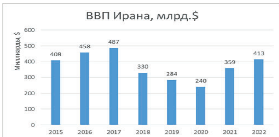
Рис. 1. Объем ВВП Ирана, 2015 – 2022 гг., в миллиардах долларов США