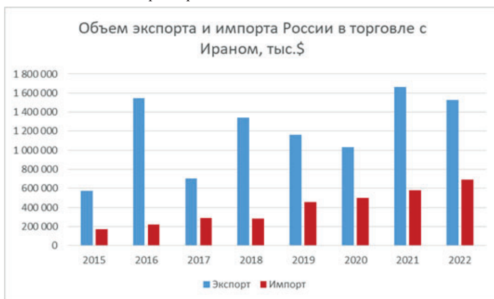
Рис. 3. Объем экспорта и импорта России в торговле с Ираном, 2015-2022, тыс. долл. США

Стоит отметить, что Россия является пятым партнером для Ирана по величине торгового оборота, который составляет 2,2 млрд долл., или 1,6%. Что касается России, то для нашей страны Иран занимает пока скромное 48-ое место с долей торгового оборота, составляющей 0,3%. Здесь также необходимо проиллюстрировать динамику внешней торговли России и Ирана, а также рассмотреть структурные сдвиги во взаимном товарообороте.