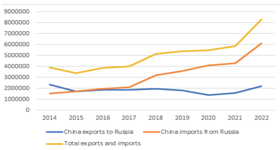
Рис. 1. Торговля КНР с РФ сельскохозяйственной продукцией (тыс. долл.)

сельского хозяйства. Кроме того, торговые трения между Китаем и США в 2018 году и начавшаяся в 2022 году СВО, все эти факторы прямо и косвенно стимулировали быстрый рост торговли сельскохозяйственной продукцией между Россией и Китаем. Китай в торговле с Россией превратился из страны с торговым профицитом в страну с дефицитом, и дефицит постепенно увеличивался. В 2023 году торговый дефицит Китая в январе-июне составил 3,32 млрд долл., что на 99,8% больше, чем за тот же период предыдущего года.