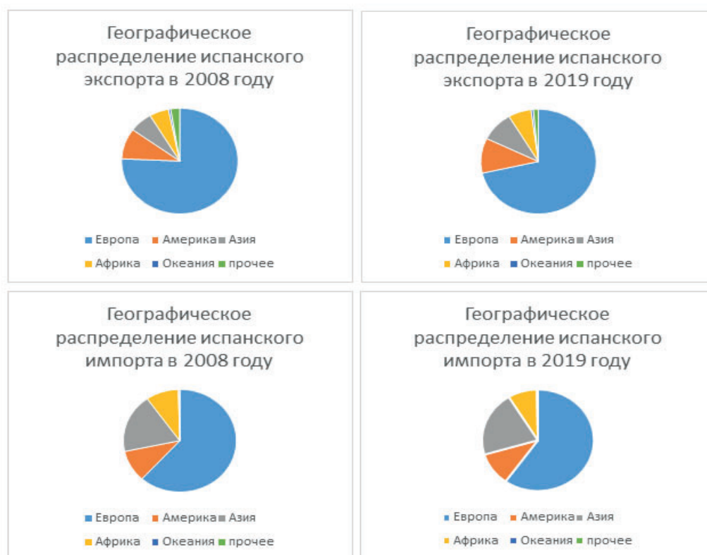
Рис.2. Внешняя торговля Испании по географическому принципу