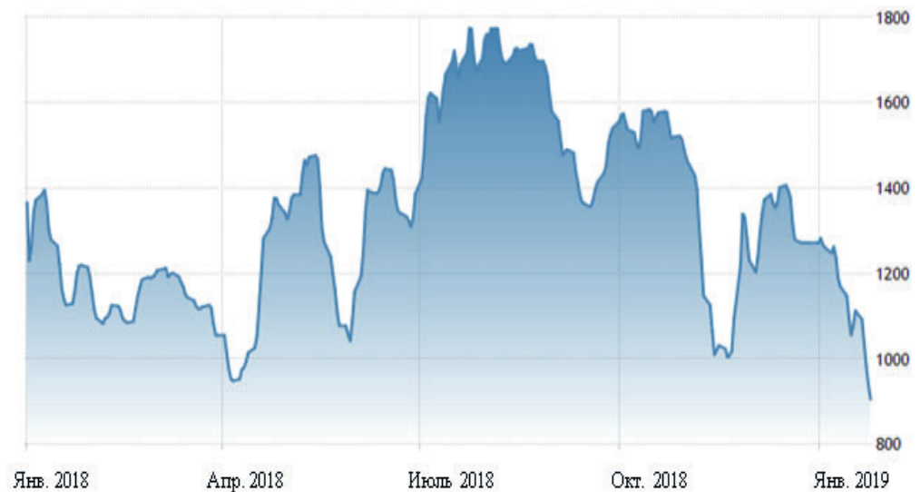
Динамика Baltic Exchange Dry Index с января 2018 г. по январь 2019 г.