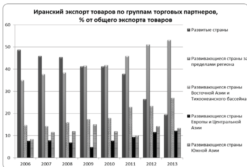
Иранский экспорт товаров по группам торговых партнеров, % от общего экспорта товаров