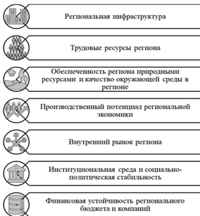
Рис. 2 – Факторы инвестиционного климата региона.

Методология Национального рейтингового агентства предлагает учет семи факторов, анализ которых позволяет выявить степень инвестиционной привлекательности региона (см. рисунок 2).