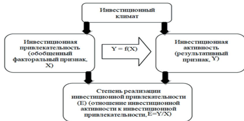
Рис. 1 - Составляющие инвестиционного климата региона

Инвестиционная привлекательность Владимирской области основывается на таких положительных факторах, как удачное географическое расположение, активный сегмент малого и среднего бизнеса, конкурентоспособный агропромышленный комплекс, историко-культурный потенциал как туристический сектор, налоговое стимулирование в виде льгот 3 .