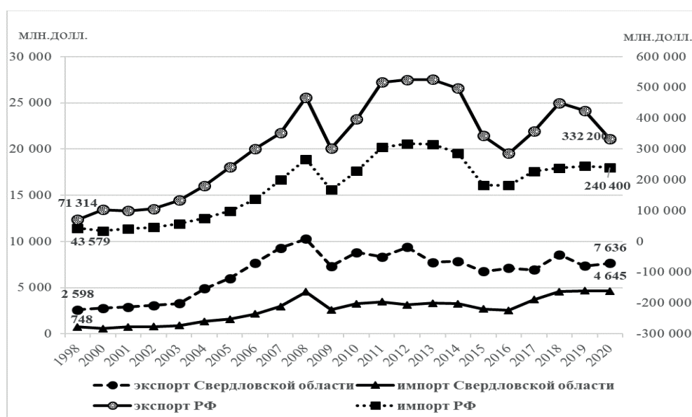
Рис. 1. Динамика экспорта и импорта Свердловской области и РФ в 1998-2020 гг., млн долл.

За период с 1998 по 2020 гг. в Свердловской области внешнеторговый оборот вырос в 3,6 раз и достиг 12,3 млрд долл., при этом рост экспорта увеличился в 2,9 раз (до 7,6 млрд долл.), а импорта в 6,2 р. (до 4,2 млрд долл.). В целом тренды как экспорта, так и импорта схожи с общероссийскими, что подтверждают высокие коэффициенты корреляции ( R=0,9 по экспорту и 0,88 по импорту, R значимы по критерию Стьюдента при \alpha=0,01 ) и детерминации ( R^2=0,82 по экспорту и 0,77 по импорту, R^2 значимы по критерию Фишера при \alpha=0,05 ). Однако по Свердловской области наблюдаются более сглаженные тренды в кризисные периоды (см. рисунок 1). В отличие от показателей России в целом в 2020 г., в Свердловской области удалось сохранить и даже немного увеличить объемы внешнеторгового оборота на 2,3%, рост по экспорту составил 3,9%, а объем импорта остался практически на уровне 2019 года, тогда как общероссийский экспорт сократился на 21,7%, а импорт на 1,6%