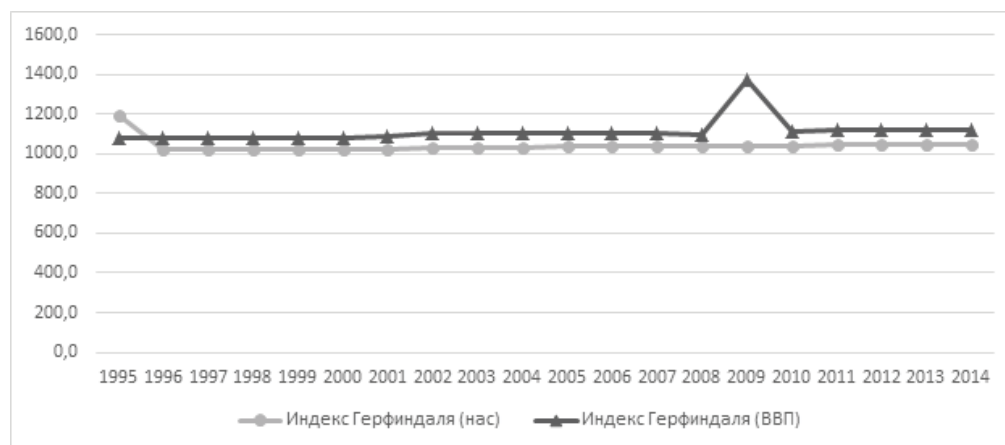
Динамика индекса Герфиндаля по ВВП и населению 1995-2014 гг.

Источник: по расчетам авторов на основе данных Национального Института Статистики Испании (Instituto Nacional de Estadística), доступ на ine.es .